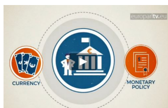
Evropská centrální banka